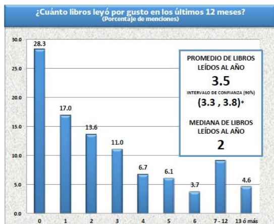
Figura 3.24. Libros leídos al año por gusto. Cálculo incluyendo a todos los informantes. * Intervalo de confianza al 90% asumiendo muestreo aleatorio simple pero con corrección por efecto de Unidades Primarias de Muestreo (UPM).

A pesar de que en la encuesta la pregunta de libros leídos al año sólo se aplicó a los entrevistados que reportaron un gusto por la lectura mayor a uno, en todas las estimaciones de libros leídos al año que se presentan a continuación, se consideran todos los informantes, imputando un valor de 0 libros leídos a aquellos que reportaron que no les gusta leer. El resultado es que en México se leen en promedio 3.5 libros al año por gusto . Alrededor de un 30% de la población lee 4 libros o más al año, mientras que un porcentaje similar no leyó un solo libro.